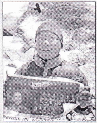
মডিউল এনালিসিসে নইটি সর্ম্বক পর্বতারোহী ওয়াভে ডিউটিয়া

সুপার ফ্লপ স্ট্রিকস নিম্নমানে তিনি ছিলেন নিম্নের সর্বকালের দামি ক্রিকেটার। ১২.৫০ কোটি টাকায় সেমি স্ট্রোকসে দল নিয়ন্ত্রিত রাজস্থান রয়্যালস।