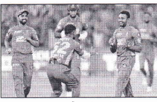
শেষে ২১ বলে ৩২ রানের ইনিংস খেলেন। শেষ দিকে নেমে জোড়া ৫ বলে ১৪ রানের ইনিংস খেলেন পোথাম।

নিম্নমানে সবেদাদাতা, জয়পুর, ১৯ মে: প্লে অফে ৩৪র্থ পর্বে শেষ অর্ধ বেটে ছিল রাজস্থান ম্যাচে জয়।