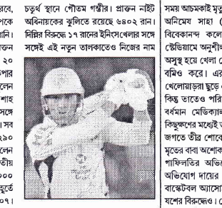
চতুর্থ স্থানে পৌঁছান। প্রাক্তন নইটি অধিনায়কের সুস্থিত রোগের ৪৪০২ রান।

নিম্নমানে সবেদাদাতা, চেন্নাই, ১৯ মে: নীরবে, নিচুতে এগের পর এক মহানুভব টপকে যাওয়ার পরে তার জায়গা মহেশ্বরি দিং গেলি।